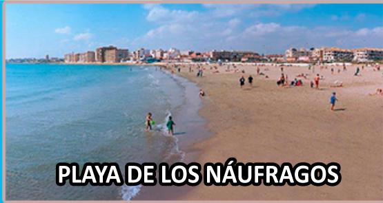
PLAYA DE LOS NÁUFRAGOS