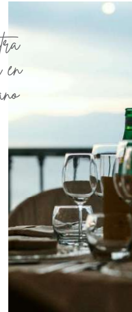
In the heart of the Costa del Sol En el corazón de la Costa del Sol