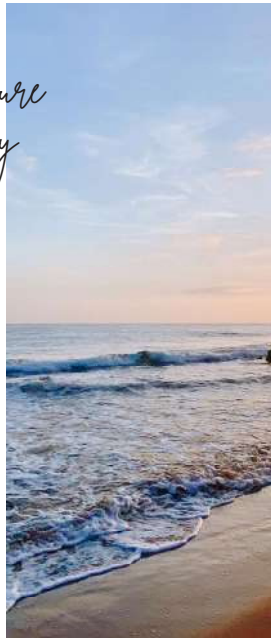
Just 3 min from the beach A tan solo 3 min de la playa