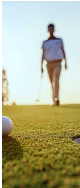
6 golf courses within a 15 km radius 6 campos de golf en un radio de 15 km