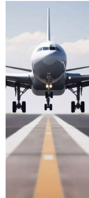
22 min from Malaga International Airport A 22 min del Aeropuerto Internacional de Málaga